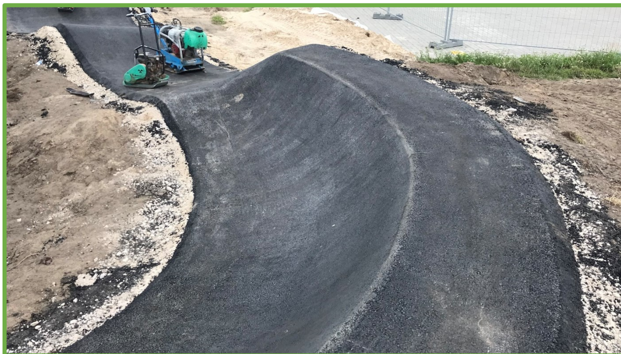
Prawidłowo wykonana nawierzchnia asfaltowa – jednorodna i gładka.

Budowa torów typu pumptrack, ciągu pieszego i placu, montaż elementów małej architektury oraz rozbudowa sieci oświetlenia i monitoringu przy ul. Armii Poznań w Czerniejewie