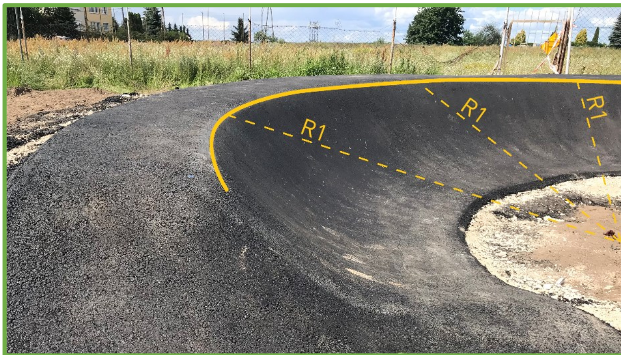
Prawidłowo wykonany zakręt profilowany – o jednostajnym promieniu zakrętu