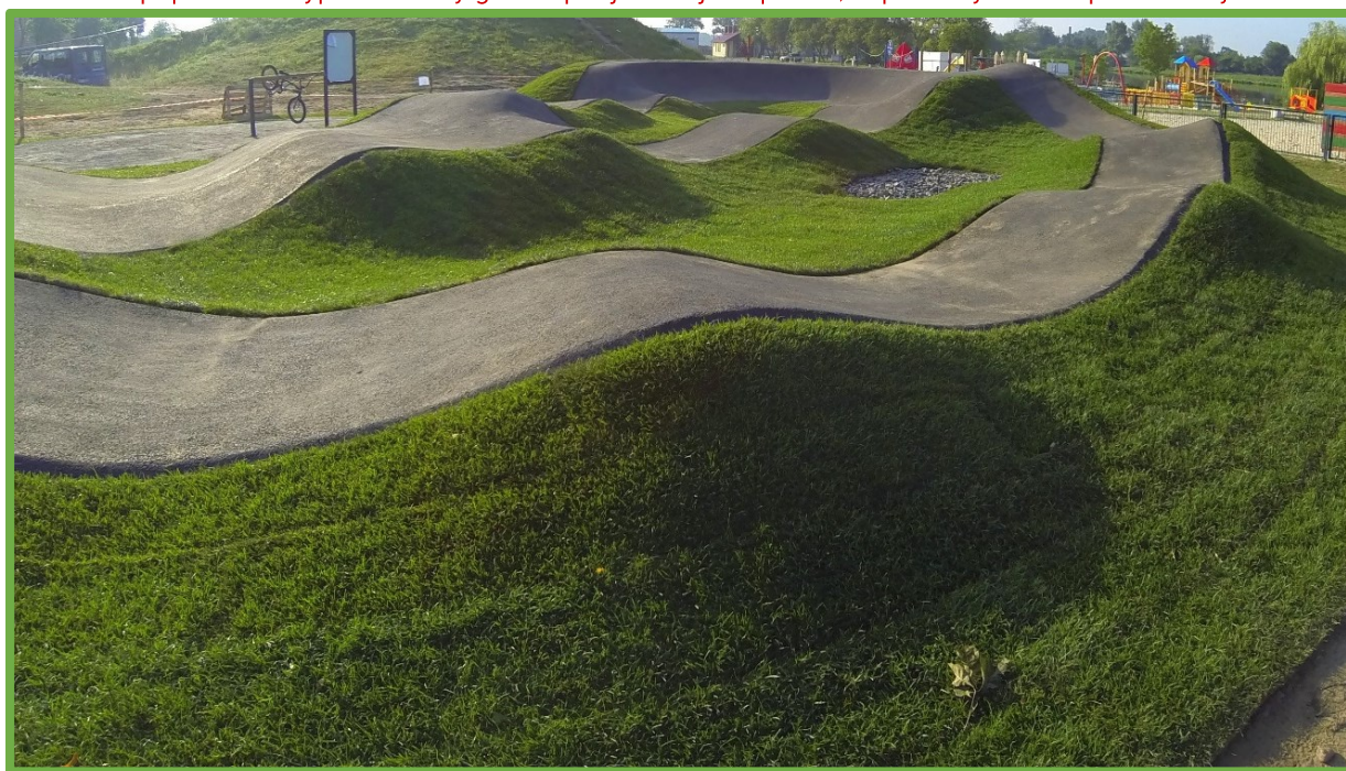
Garby o prawidłowo wyprofilowanych kształtach

Wszystkie krawędzie warstwy jezdnej muszą być sfazowane pod kątem 45^{\circ} ( \pm 5^{\circ} ). Fazowanie i zagęszczanie krawędzi musi odbywać się podczas układania warstwy. Niedopuszczalne jest fazowanie (cięcie) po wystygnięciu masy mineralno-asfaltowej. Krawędzie muszą być wykonane w równej linii, bez pęknięć i ubytków.