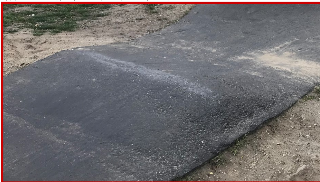
Niepoprawnie wykonany garb – o licznych nierównościach i złym kształcie

Wszystkie przeszkody wchodzące w skład toru pumptrack (garby, muldy, przeszkody złożone itp.) muszą być wyprofilowane w taki sposób, aby umożliwiły płynną jazdę. Niedopuszczalne jest wyprofilowanie przeszkód wymuszających "nerwową jazdę" tzn. zbyt ostrych, o szpiczastych kształtach.