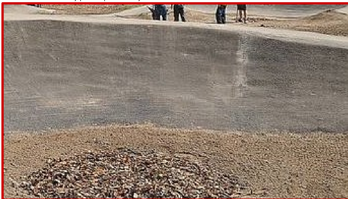
Nieprawidłowe połączenie nawierzchni jezdnej w miejscu przerwy technologicznej

Połączenia nawierzchni jezdnej w miejscach przerw technologicznych muszą być tak wykonane, aby nie były wyczuwalne uskoki ani zmiany profilu przeszkody.