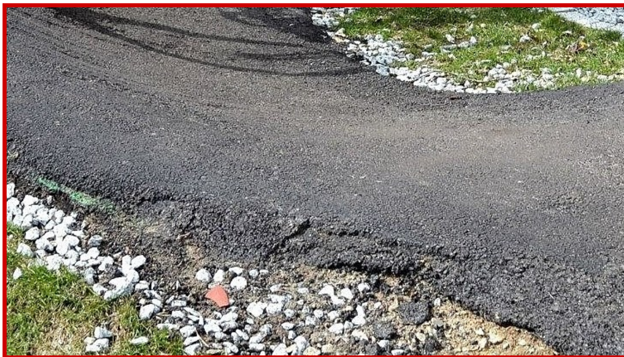
Nieprawidłowe wykończenie krawędzi nawierzchni jezdnej – nierówne, bez fazowania, z ubytkami i pęknięciami.