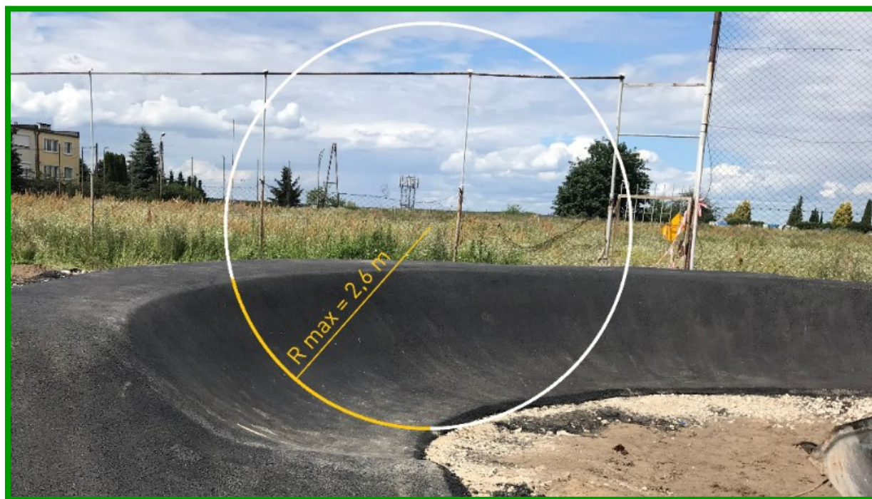
Prawidłowo wykonany zakręt profilowany, którego przekrój stanowi wycinek koła.

Budowa torów typu pumptrack, ciągu pieszego i placu, montaż elementów małej architektury oraz rozbudowa sieci oświetlenia i monitoringu przy ul. Armii Poznań w Czerniejewie