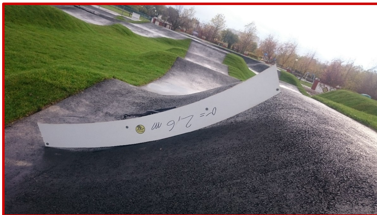
Nieprawidłowo wykonany zakręt profilowany, którego przekrój nie stanowi wycinka koła.

Warstwa jezdna wszystkich zakrętów musi być w przekroju wycinkiem koła o promieniu nie większym niż 2,6 m. Niedopuszczalne jest stosowanie zakrętów profilowanych (tzw. band), które są w przekroju płaskie lub ich promień jest niejednostajny. Wyjątek stanowi dolna półka bandy, która może być wyplaszczona.