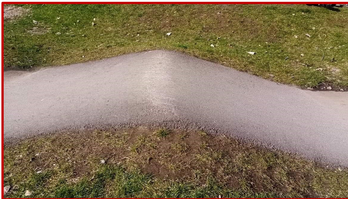
Niepoprawnie wyprofilowany garb – podjazd i zjazd płaski, szpiczasty kształt przeszkody