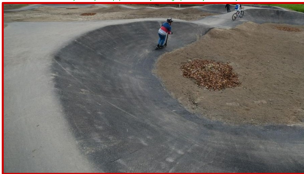
Nieprawidłowo wykonany zakręt o niejednostajnym promieniu, bez wypłaszczonej dolnej półki oraz niebędący w przekroju wycinkiem koła.